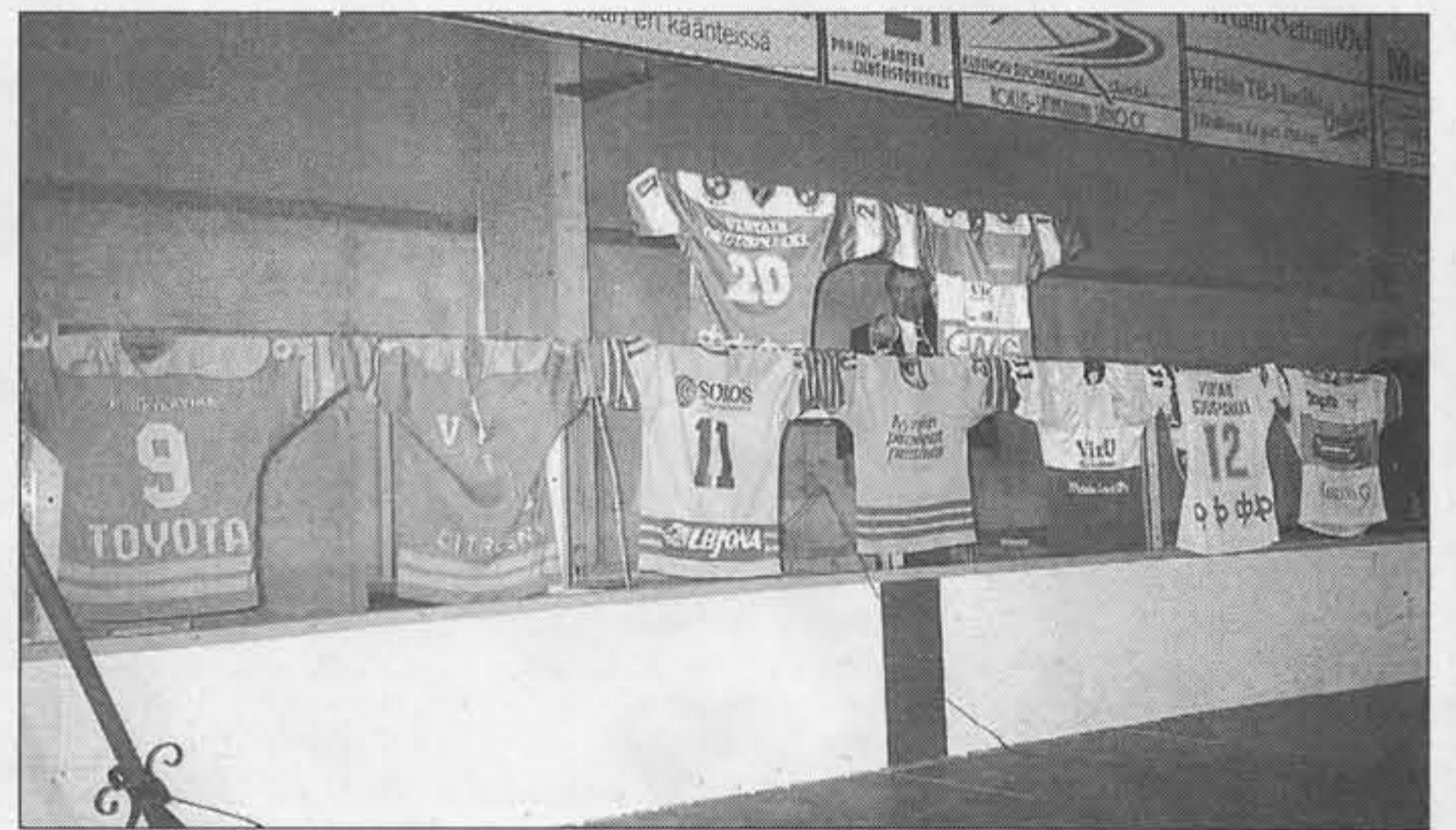
Seuran edustusasuja eri vuosilta ja vuosikymmeniltä.

Tämän ajan- ja rahankäytön hän toivoi kuitenkin palkitsevan itsensä myöhemmin, kun lapset muistelevat sitä myöhemmällä iällään ja toivottavasti muistelevat sitä hyvällä.